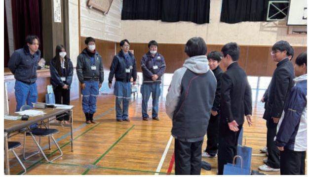
森井会員【オペレーターという仕事】