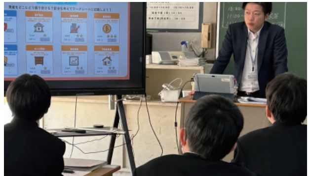
山口会員【わたしのライフデザイン】～みらいとつなぐ