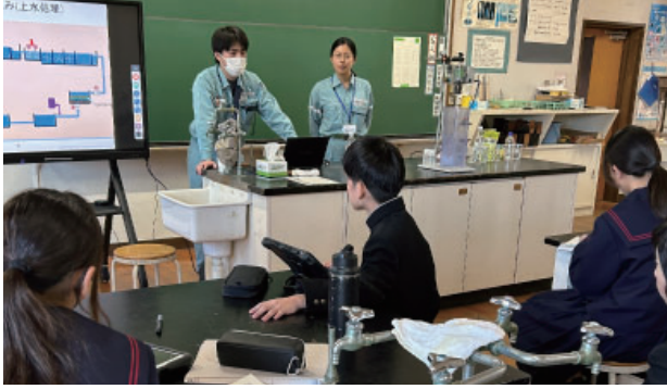
鳥取会員【水をきれいにする仕事】