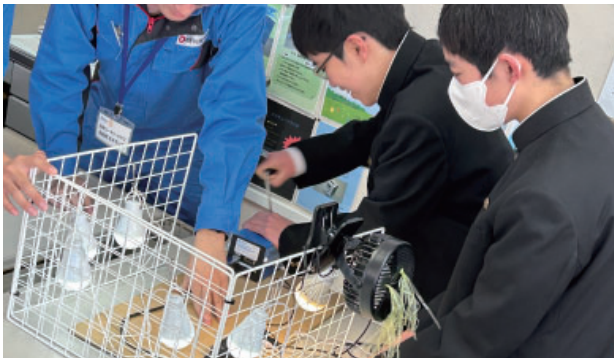
石野会員【電気をつくる仕事～わたしたちの暮らしを支える電気～】