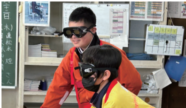
永蔭会員【病院のお仕事とリハビリについて】