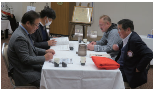
社会奉仕委員会・R財団委員会