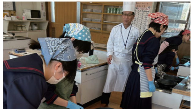
早見会員【テーブルマナー&美味しいステーキの焼き方】