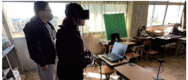
情報技術を使った設計の仕事