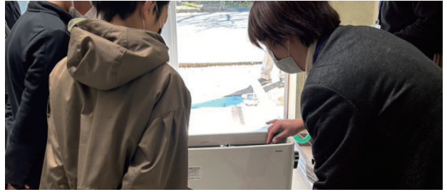
水の大切さと、最新トイレの節水技術について