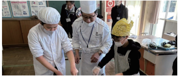
テーブルマナー&美味しいステーキの焼き方