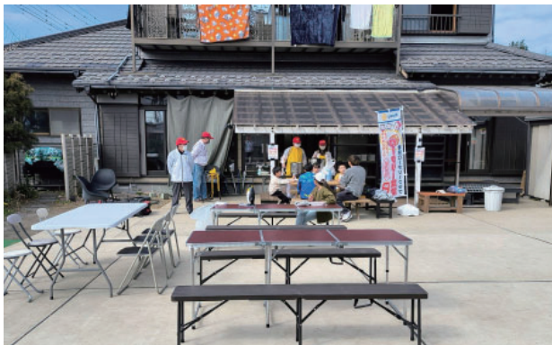
子ども食堂の様子 (R7.2.15)