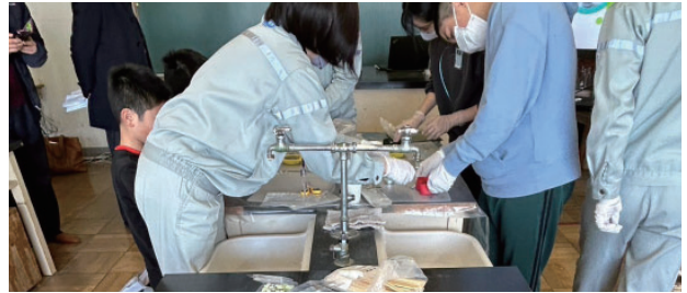
製鉄所内のエコな仕事