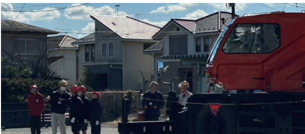
クレーン車ってなに？