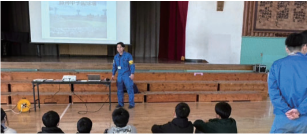
オペレーターという仕事