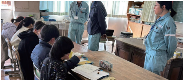
水をきれいにする仕事