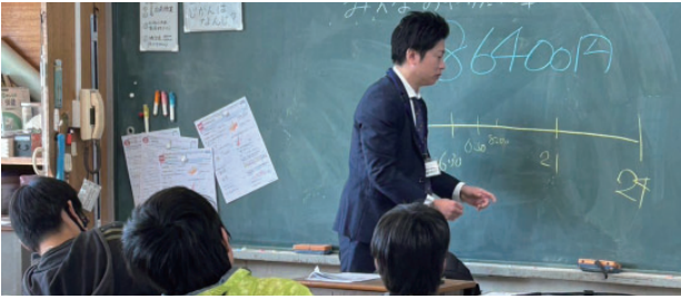
わたしのライフデザイン