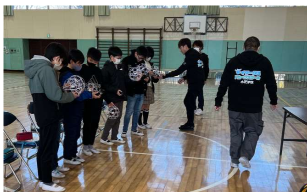
ドローンの基礎知識と操作方法