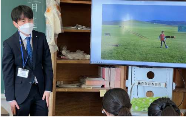
留学生から見た日本とモンゴルの相違点について