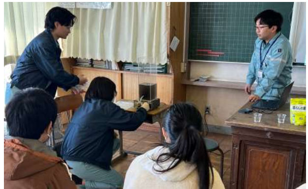
水をきれいにする仕事