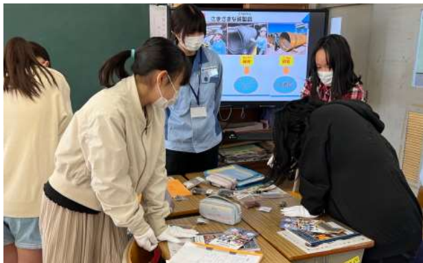
知ってそうで知らない? 鉄のすごさ!