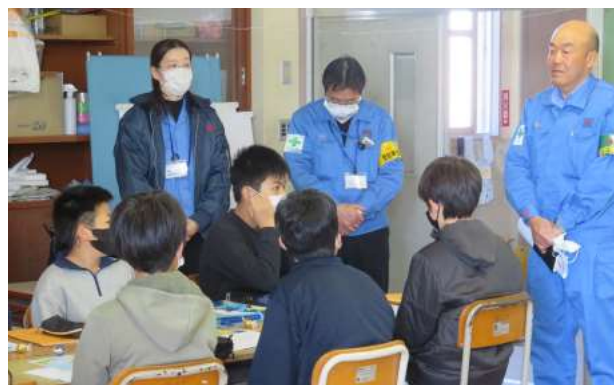
みなとのおしごと