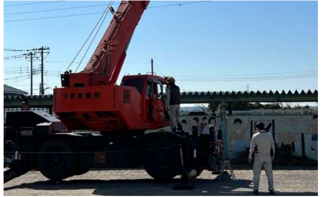
クレーン車ってなに？