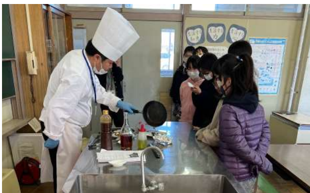
テーブルマナー&美味しいステーキの焼き方