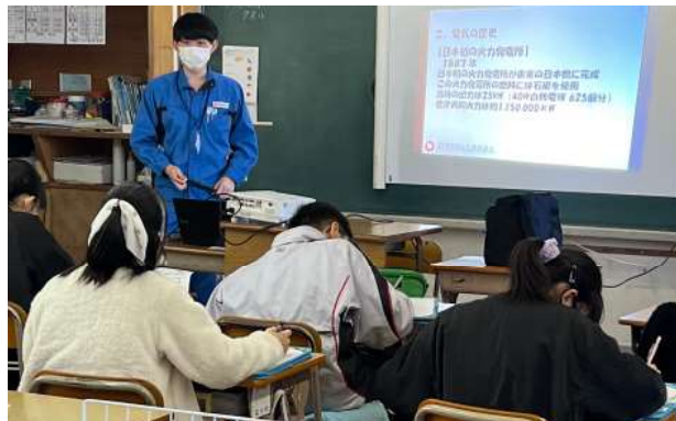
電気をつくる仕事～わたしたちの暮らしを支える電気～