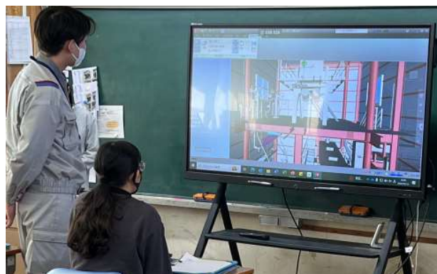
情報技術を使った設計の仕事