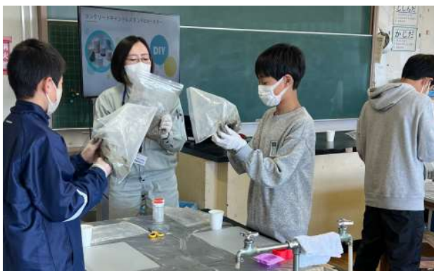
製鉄所内のエコな仕事