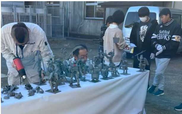
溶接でスクラッチロボをつくろう！