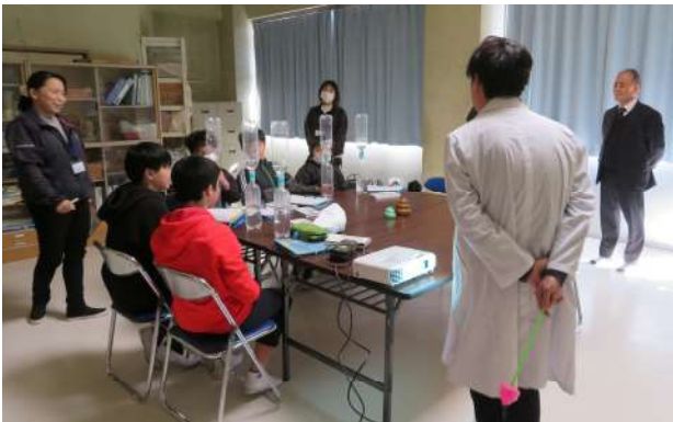
水の大切さと、最新トイレの節水技術について