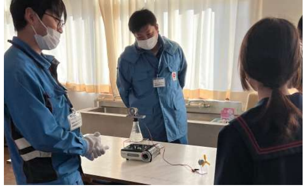
【電気をつくる仕事~わたしたちの暮らしを支える電気~】