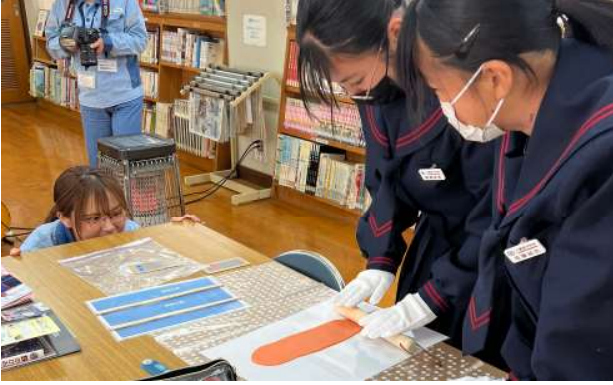
【知ってそうで知らない?鉄のすごさ!】