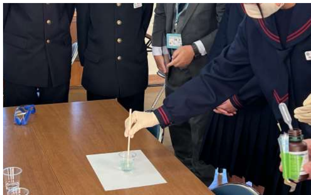
【水をきれいにする仕事】