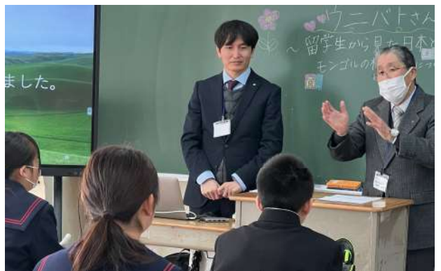
【留学生から見た日本とモンゴルの相違点について】