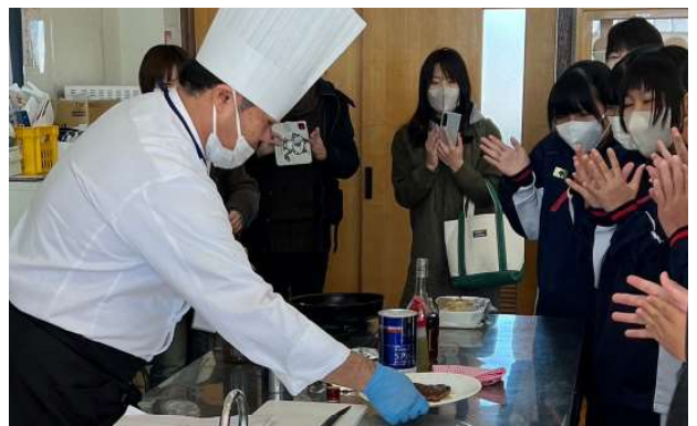
【テーブルマナー & 美味しいステーキの焼き方】