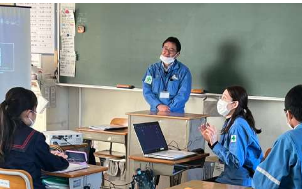
【みなとのおしごと】