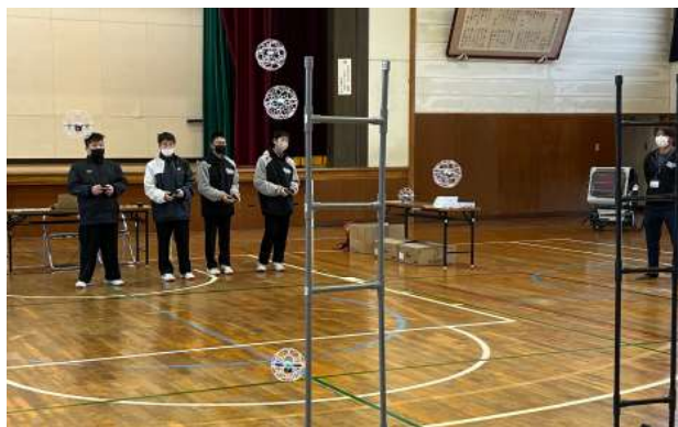
【ドローンの基礎知識と操作方法】