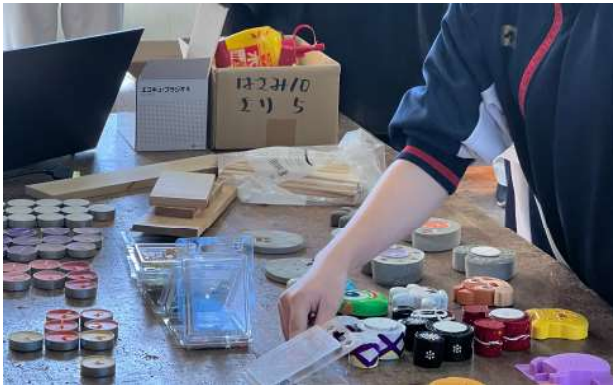
【製鉄所内のエコな仕事】