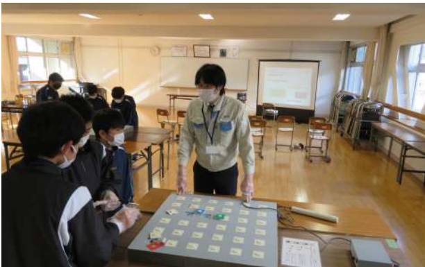
倉繁会員『磁気の不思議』