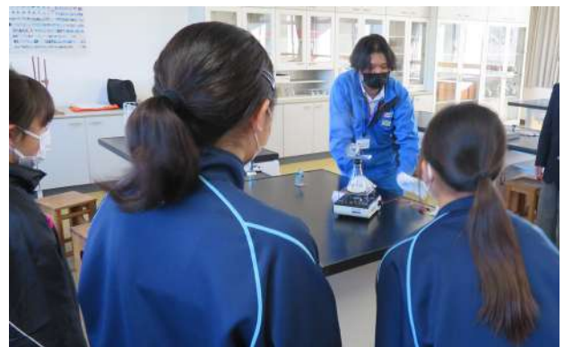
原田会員『電気をつくる仕事』