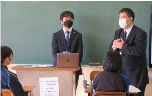
ユニバト君『留学生から見た日本とモンゴルの相違点について』