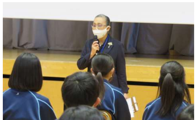
全体式での武田会長挨拶