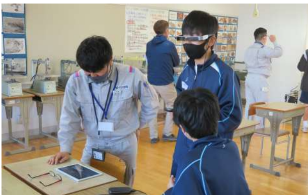
常任会員『情報技術を使った設計の仕事』