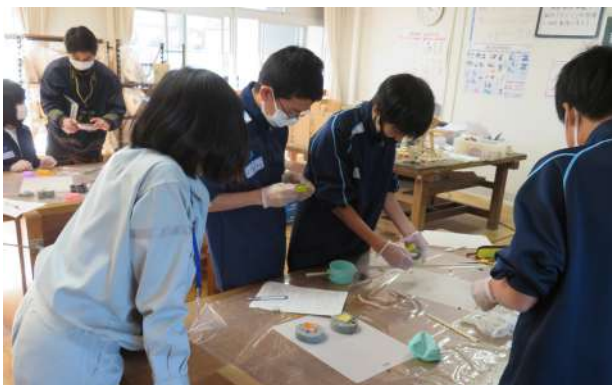
高島会員『製鉄所内エコな仕事』