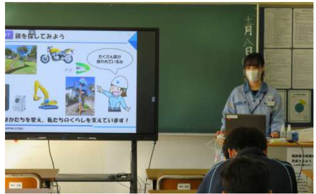
小関会員『知って知らない?鉄のすごさ!』